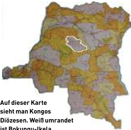
Auf dieser Karte sieht man Kongos Diözesen. Weiß umrandet ist Bokungu-Ikela.

► sche Noviziat der Herz-Jesu-Missionare und der Missionarinnen Christi in Mondombe bzw. in Ikela. Als vierte Gemeinschaft sind die Josephsbrüder in der Diözese tätig.