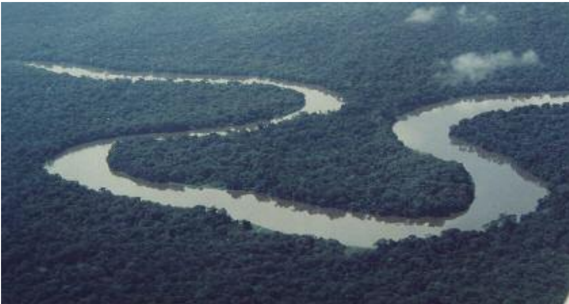
Die Urwalddiözese liegt am Tshuapa-Fluss im Herzen der Demokratischen Republik Kongo. Sie ist etwa halb so groß wie Bayern oder Österreich. Von den 650 000 Einwohnern sind etwa 16 Prozent Katholiken.