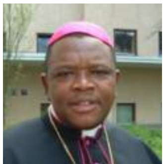
Der Kapuziner Fridolin Ambongo ist seit 2005 Bischof der Diözese.