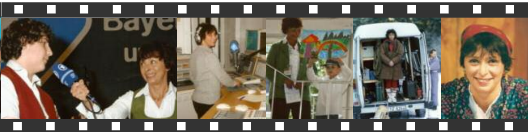
In der Sendung „Bayern 1 unterwegs“; im Studio; beim ökumenischen Nachbarschaftstreff; bei einem Dreh fürs Bayerische Fernsehen in Zwiesel; als „Kuni“ im Theaterstück „Liebe macht blind“.