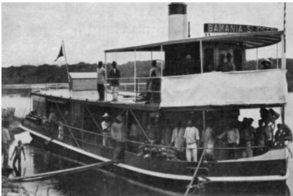
Das Schiff der Trappisten „Bamania St. Joseph“ erreichte 1914 erstmals Ikela. Dieses Ereignis, mit dem Versuch, einen Missionsposten in Yokombola nahe der Pflanzung Yalusaka zu gründen, kann als der Beginn der Evangelisation im Gebiet der heutigen Diözese betrachtet werden.

Coquilhatville. Später wurde sie in Bokungu-Ikela umbenannt.