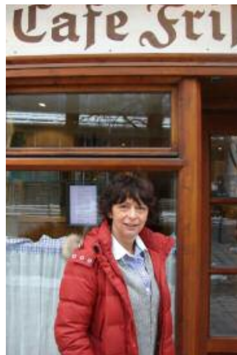
Vor ihrem Stammcafé Frischhut am Viktualienmarkt - ganz in der Nähe ihrer Wohnung.

Wenn ich überhaupt eine Maxime zu verkün-