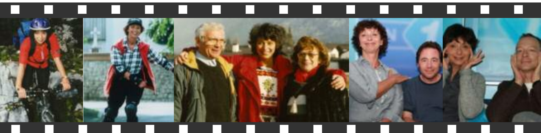
Impressionen aus dem privaten und beruflichen Leben von Conny Glogger: beim Radeln und Skaten; mit ihren Eltern; auf der „Blauen Couch“ mit Bully Herbig und Christoph Süß.

Ich fürchte, die Vertreter all dieser Gruppen zeichnen sich dadurch aus, dass sie Argu-